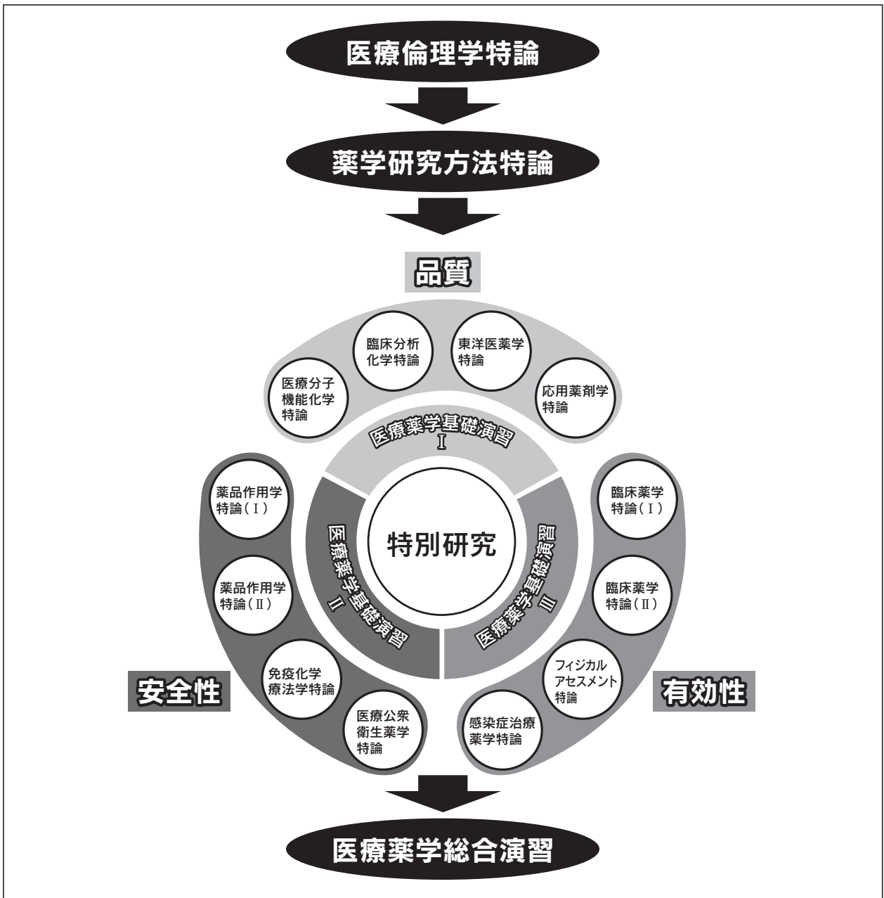
【九州保健福祉大学大学院 医療薬学研究科 医療薬学専攻 カリキュラムの構成図】