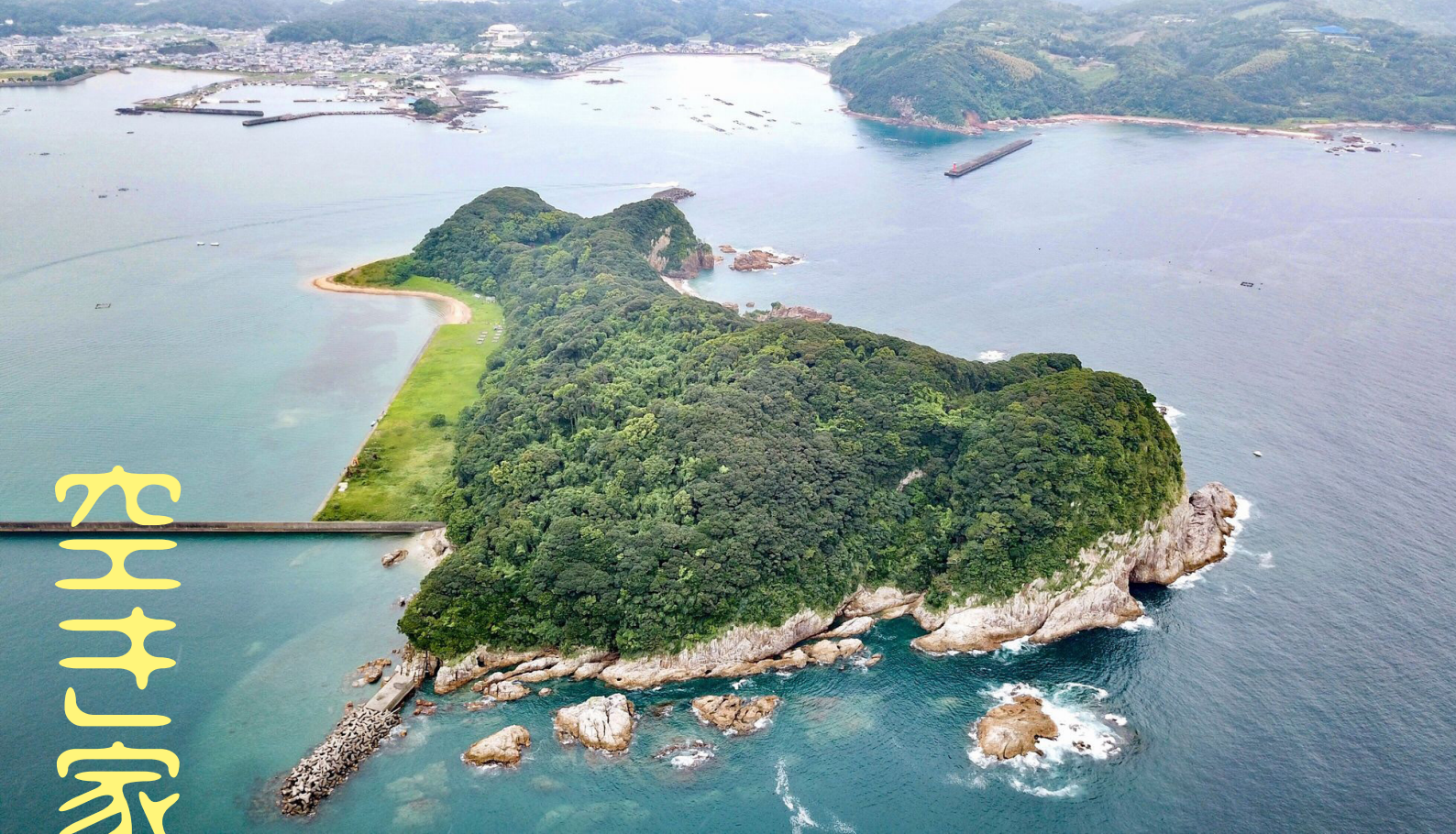
日向灘に浮かぶ乙島から、門川町沿岸部を観る。